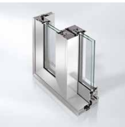
Schüco hefschuifstelsysteem ASS 70.HI Système coulissant à lever Schüco ASS 70.HI