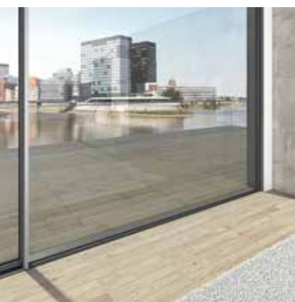
Barrièrevrije doorgang door verzonken profielen Intégration parfaite dans le sol, sans obstacle